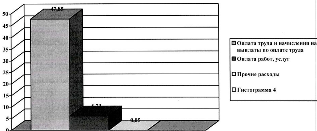
Структура расходов (млн.руб.)

В 2023 году 88,42% расходов субсидии составила оплата труда и начисления на выплаты, 11,49% расходы, связанные с обеспечением текущей деятельности учреждения и 0,09% прочие расходы.